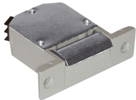
Podstawowe wymiary zaczepu R1