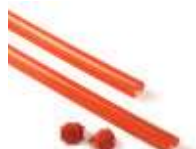
XBA13 listwy ochronne, gumowe, czerwone na ramię XBA 9x1 m 120,00 147,60 brutto