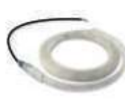
XBA4 diodowe światła ostrzegawcze 4 m 180,00 221,40 brutto