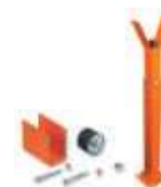
WA11 podpora ramienia stała, regulowana wysokość 250,00 307,50 brutto