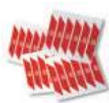
WA10 nalepki ostrzegawcze na ramię szlabanu (24 szt.) 80,00 98,40 brutto