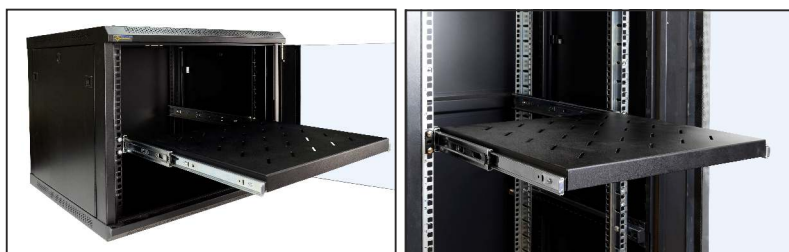
pełny wysuw półki