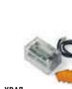
XBA7 moduł lampy sygnalizacyjnej do szlabanów BAR 175,00 215,25 brutto