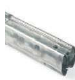
XBA9 łącznik do ramion XBA15/XBA14/XBA5 80,00 98,40 brutto