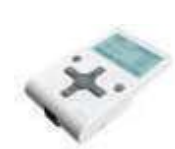
OVIEW/A programator, połączenie za pomocą BUS T4 650,00 799,50 brutto