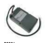
PS224 akumulator 24V 7.2 Ah z wbudowaną kartą ładowania 460,00 565,80 brutto