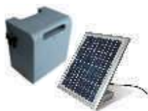
SOLEMYO (SYKCE) zestaw zasilania słonecznego 1 350,00 1 660,50 brutto