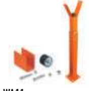
WA11 podpora ramienia stała, regulowana wysokość 250,00 307,50 brutto