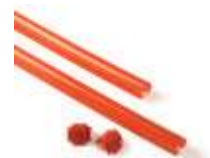
XBA13 listwy ochronne, gumowe, czerwone na ramię XBA, 9x1 m 120,00 147,60 brutto