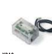
XBA8 moduł semaforów do szlabanów BAR 250,00 307,50 brutto