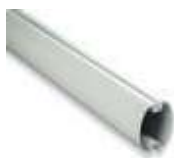
XBA15 ramię aluminiowe, owalne, 69x92x3150 mm 200,00 246,00 brutto