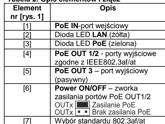
Tabela 2. Opis elementów i złączy