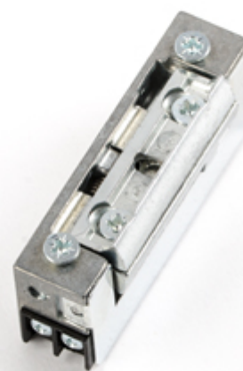
Wymiary i zdjęcie zacze­pu