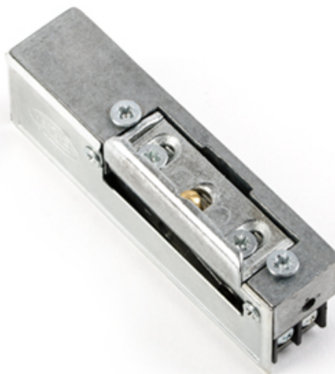
Wymiary i zdjęcie zaczeu