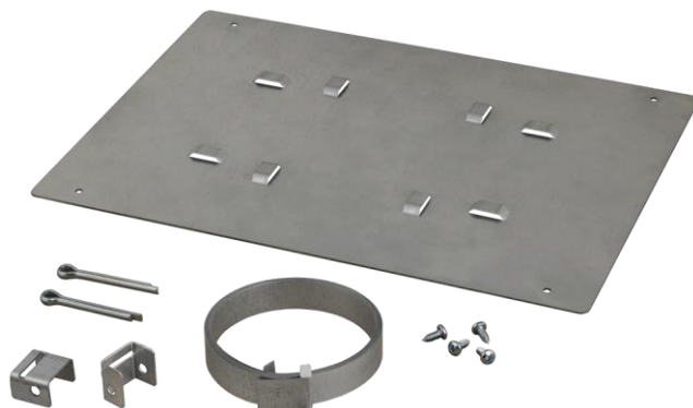
Rys. 1 Widok zawartości zestawu.