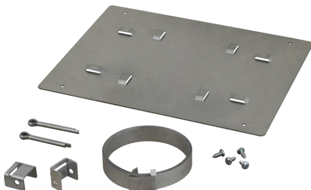
Rys. 1 Widok zawartości zestawu.