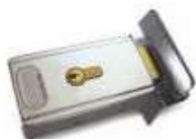
PLA10 zamek elektromagnetyczny pionowy