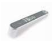
MEA5 dźwignia odblokowująca do MEA3 (dodatkowa)