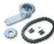
MEA1 akcesoria zwiększające kąt otwarcia do 180°