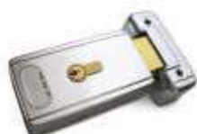
PLA11 zamek elektromagnetyczny poziomy