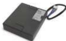
PS324 akumulator 24V 2.2 Ah z wbudowaną kartą ładowania do centrali MC824H