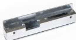
Kaseta uniwersalna cynkowana z szyldem do kaset cynkowanym (do nabycia osobno)