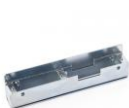
Kaseta uniwersalna cynkowana