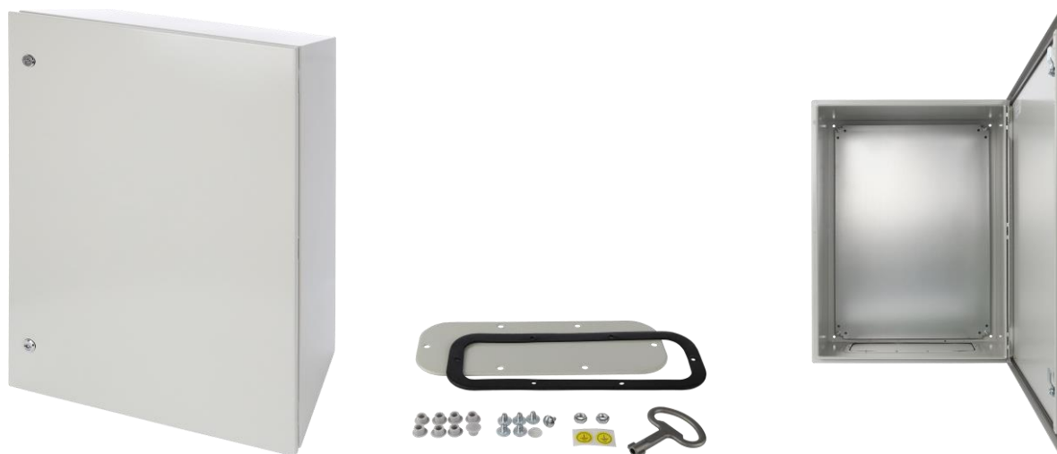
Rysunek 1. Widok obudowy.