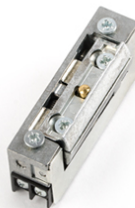
Wymiary i zdjęcie zaczepu